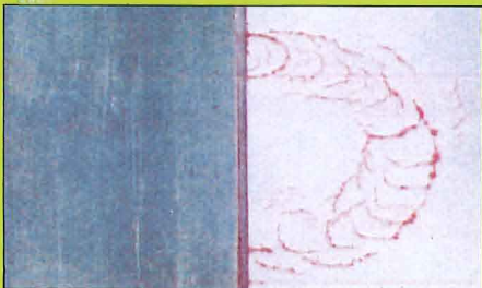
(20℃で浸透10分/現像15分の実例)